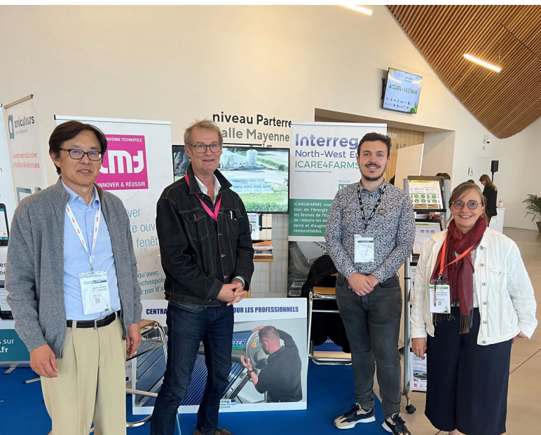
Vertegenwoordigers van Fengtech en LMT op de Agri-Food Convention in Laval afgelopen Oktober.